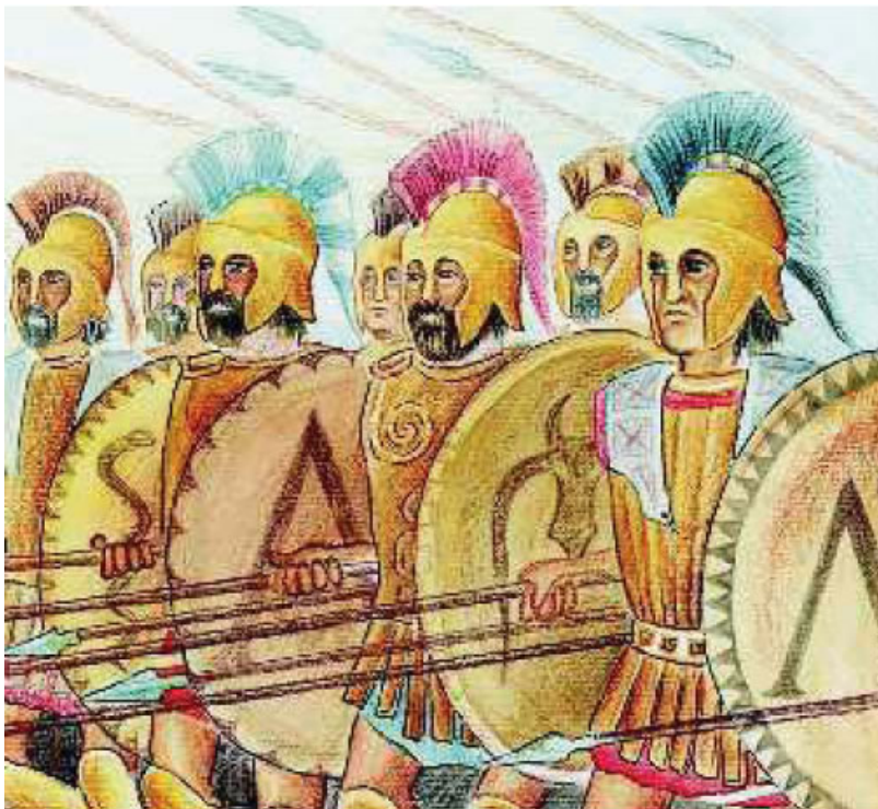
1. Σπαρτιατική φάλαγγα

η φάλαγγα: στρατιώτες, παρατεταγμένοι ο ένας δίπλα στον άλλο, έτοιμοι για μάχη