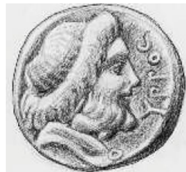
3. Αναπαράσταση από σπαρτιατικό νόμισμα. Το πρόσωπο που απεικονίζεται είναι ο Λυκούργος