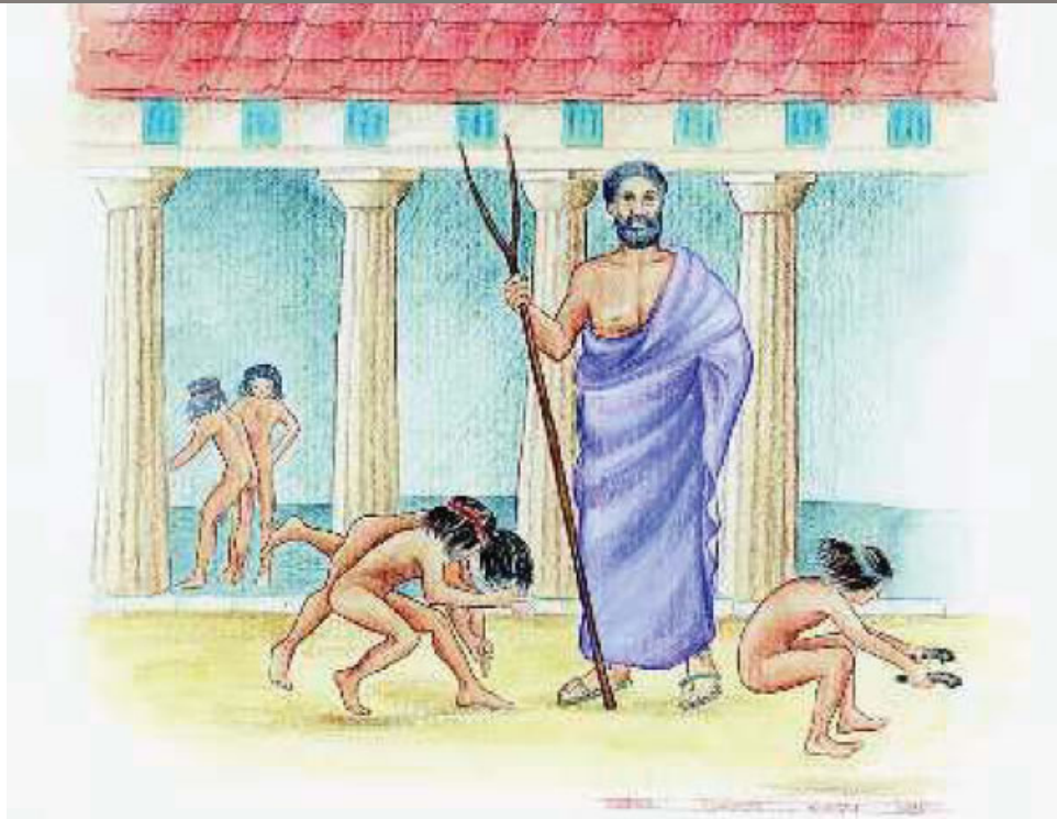
2. Οι νέοι στη Σπάρτη γυμνάζονταν καθημερινά

Στις γιορτές των Σπαρτιατών υπήρχαν τρεις χοροί ανάλογοι με τις τρεις ηλικίες του ανθρώπου. Πρώτα άρχιζε ο χορός των γερόντων που τραγουδούσε: «Ήμαστε κι εμείς κάποτε γενναίοι». Στη συνέχεια τους απαντούσε ο χορός των αντρών που έλεγε: «Εμείς είμαστε τώρα γενναία παλικάρια, κι αν έχεις τη δύναμη τόλμησε». Τρίτος τραγουδούσε ο παιδικός χορός που έλεγε: «Εμείς θα γίνουμε μια μέρα πολύ καλύτεροι από εσάς».