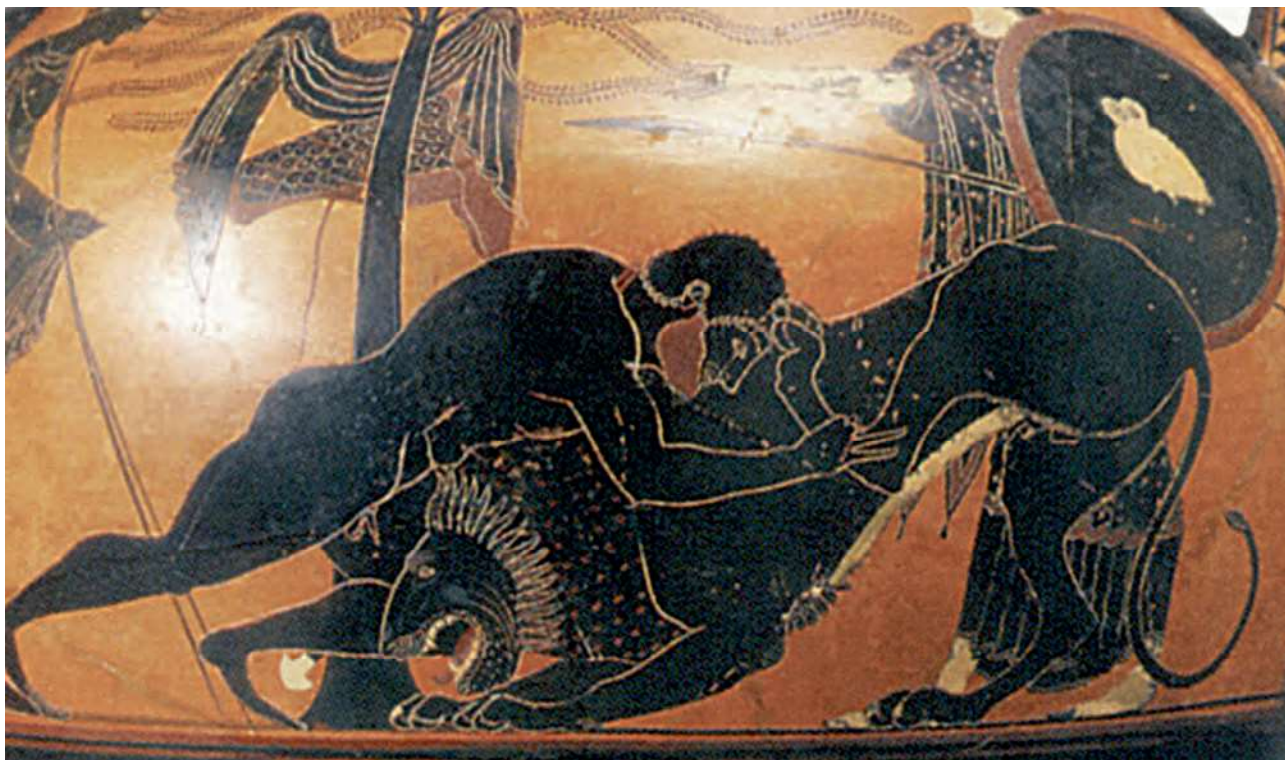
1. Ο Ηρακλής παλεύει με το λιοντάρι της Νεμέας. Από αρχαίο ελληνικό αγγείο.

Ο Ηρακλής, πηγαίνοντας στη Νεμέα , πέρασε από το ιερό άλσος της πόλης, έκοψε μια αγριελιά κι απ' τον κορμό της έφτιαξε ένα βαρύ ρόπαλο . Μετά πήγε και περίμενε κοντά στη φωλιά του λιονταριού και, όταν αυτό φάνηκε, το χτύπησε πρώτα με τα βέλη του. Τα βέλη έπεσαν στη γη χωρίς να το τραυματίσουν και το λιοντάρι επιτέθηκε στον Ηρακλή. Εκείνος το χτύπησε με το ρόπαλο. Το λιοντάρι πόνεσε και κρύφτηκε στη φωλιά του. Ο Ηρακλής τότε μάζεψε μεγάλες πέτρες, έκλεισε τη μια είσοδο και μπήκε από την άλλη. Το ζώο βρυχήθηκε και σείστηκε όλο το βουνό. Όρμησε πάνω στον ήρωα και πάλευαν μια ώρα. Τέλος, ο Ηρακλής τύλιξε τα χέρια του γύρω από τον λαιμό του και το έπνιξε. Μετά πήρε το δέρμα του, τη λεοντή , το φόρεσε και γύρισε στις Μυκήνες. Όταν τον είδε ο Ευρυσθέας , τρόμαξε πολύ και διέταξε να του φτιάξουν ένα χάλκινο πιθάρι, για να κρύβεται, όταν θα κινδύνευε.