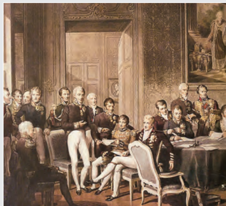
Το Συνέδριο της Βιέννης (1815)

Η σύσταση της Φιλικής Εταιρείας έγινε σε μια ιδιαίτερα δυσμενή για την ελληνική υπόθεση στιγμή. Το 1815 νικήθηκε οριστικά ο Ναπολέοντας και οι φιλελεύθερες ιδέες της Γαλλικής Επανάστασης παραμερίστηκαν. Τότε ιδρύθηκε η Ιερή Συμμαχία με πρωτοβουλία των νικητών (κυρίως της Αυστρίας, της Ρωσίας και της Πρωσίας), οι οποίοι επιθυμούσαν να διατηρηθεί το «παλαιό μοναρχικό καθεστώς». Για τον λόγο αυτό, ήταν αντίθετοι σε κάθε επαναστατική κίνηση, καταδικάζοντας την ως επικίνδυνη.