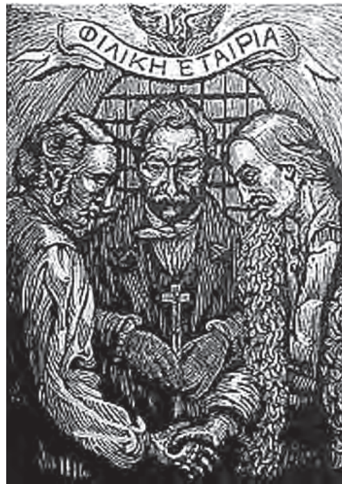
▲ Ο όρκος των Φιλικών

Η Φιλική Εταιρεία ιδρύθηκε επτά χρόνια πριν από την έναρξη της Μεγάλης Επανάστασης του 1821, με σκοπό να συντονίσει τις προσπάθειες των υπόδουλων Ελλήνων για την απελευθέρωσή τους. Η οργάνωση ιδρύθηκε μυστικά στην Οδησσό της Ρωσίας, το 1814, από τρεις άσημους εμπόρους, τον Εμμανουήλ Ξάνθο, τον Νικόλαο Σκουφά και τον Αθανάσιο Τσακάλωφ.