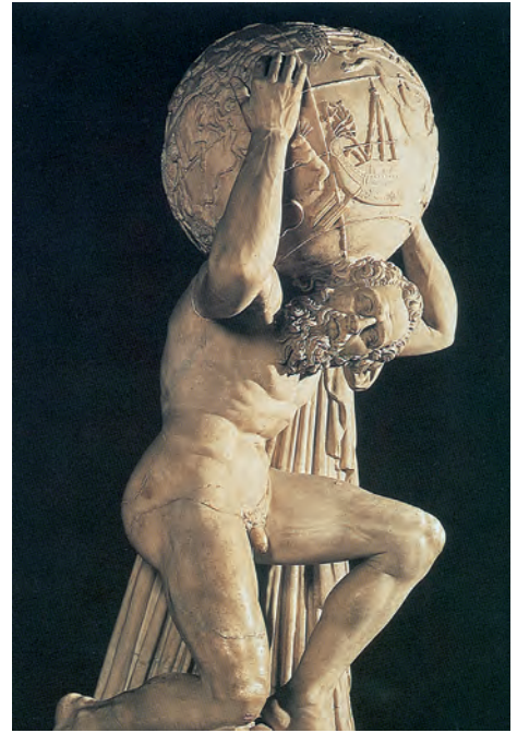
6. Ο Άτλαντας σε γλυπτό νεότερης εποχής.