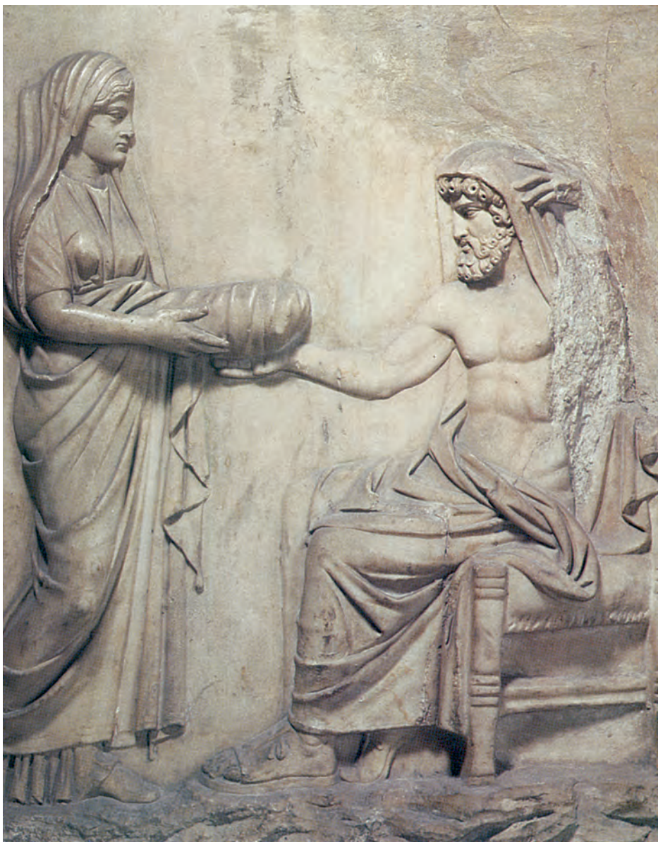
1. Η Ρέα δίνει τη φασκιωμένη πέτρα στον Κρόνο.

Έτσι, ο Δίας έγινε κυρίαρχος όλη του κόσμου. Παντρεύτηκε την Ήρα και, μαζί με τα παιδιά του και τ' αδέρφια του, εγκαταστάθηκε στον Όλυμπο.