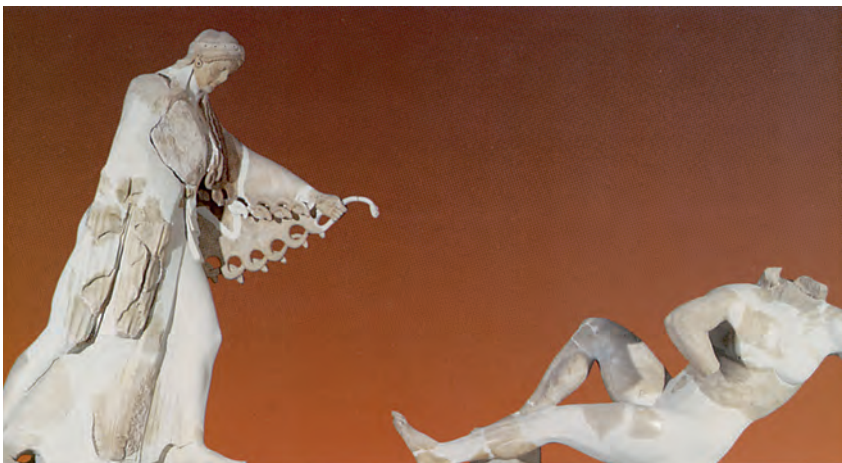
9. Η Αθηνά μάχεται με τον Εγκέλαδο. Από την παράσταση της Γιγαντομαχίας στον αρχαίο ναό της Αθηνάς, στην Ακρόπολη.

Απολλόδωρος, Βιβλιοθήκη Α , 6, 2 (διασκευή)