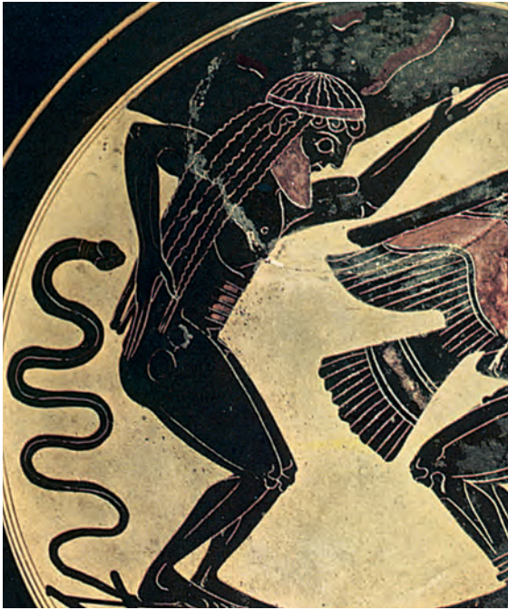
5. Ο Άτλαντας σε αρχαίο ελληνικό αγγείο.