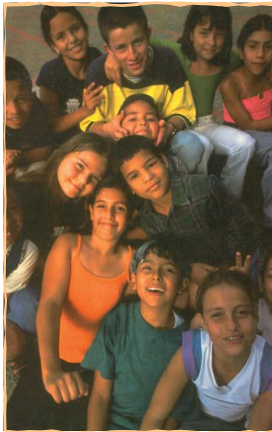
Unicef, Donna De Cesare, περιοδικό Κόσμος , τεύχος 63ο, Χειμώνας 2006

Χάρης Σακελλαρίου, Το βιβλίο των τραγουδιών , εκδ. Ελληνικά Γράμματα, Αθήνα, 2002